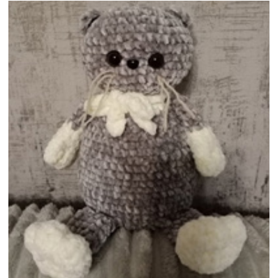
Котик Басик | Работа Н.В Ивашкиной дома не задерживаются, сыновья мои разбирают их на подарки.

Еще мне очень нравится вязать игрушки. Нет, на заказ я не вяжу. Вяжу только то, что нравится мне, когда приходит вдохновение. Игрушки долго у меня