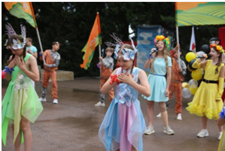
Выступление среднего состава «Ауры». 2023 г.

«Аура» в этом году получила премию «Гордость России», Гран-при премии Правительства культуры РФ детского и юношеского танца «Весна священная». Это национальная премия высокого ранга, организована Фондом имени Илзе Лиепы. Сейчас они летят в Москву и будут