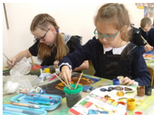
Урок рисования в 3«Б». 2023г.

А наши учителя? Такие серьезные на уроках, они тоже могут петь, танцевать, вышивать крестиком, рисовать картины, вязать необыкновенной красоты вещи. Наши учителя дают открытые уроки, мастер-классы, участвуют во всероссийских кон-