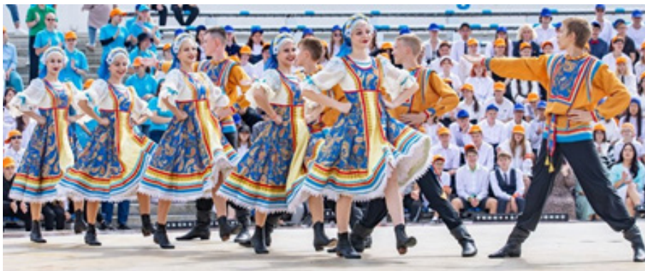
Выступления ансамбля «Калинка». ВДЦ «Океан». 2023 г.

— На ваших концертах всегда феерия красок, очень яркие костюмы. Как часто обновляется костюмный фонд?