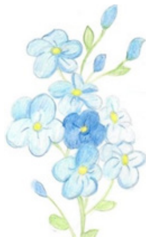
Незабудка | Рисунок Анастасии Тутубалиной, 10 «Б»