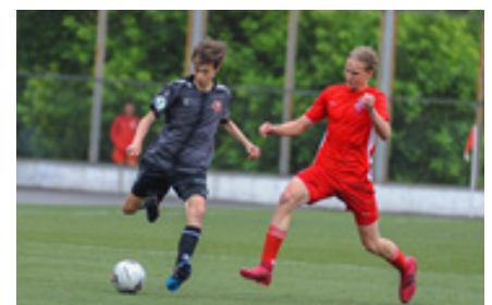
Лучший защитник М. Погорелов