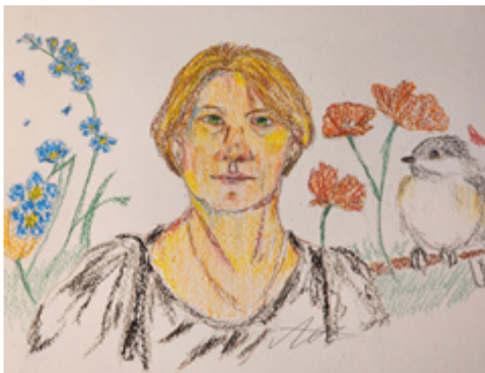
Мамочка | Рисунок Киры Моцартовой, 10 «А»