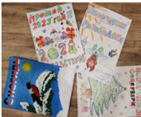
Книжки-развивайки для первоклассников. 4 «В».

Мы же не замечаем, что мы дышим. Мы не замечаем, что постоянно творим. Заниматься творчеством так же естественно, как дышать. Многие ученики лицея «дышат» своим делом, создавая прекрасное. Человеку так важно «загореться» делом и, не туша этот огонь в глазах, создавать то новое и прекрасное, что будет достойно внимания других. В душе каждого из нас живет творчество, которое позволяет изменить к лучшему ту реальность, в которой мы живем. Мы каждый раз с восхищением говорим о наших художниках, певцах и танцорах, гордимся призёрами и победителями олимпиад разного уровня, смотрим в их горящие глаза и восхищаемся ими.