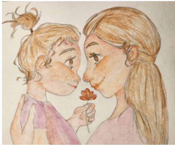
Мама. Глаза в глаза | Рисунок Кире Моцартовой, 10 «А»